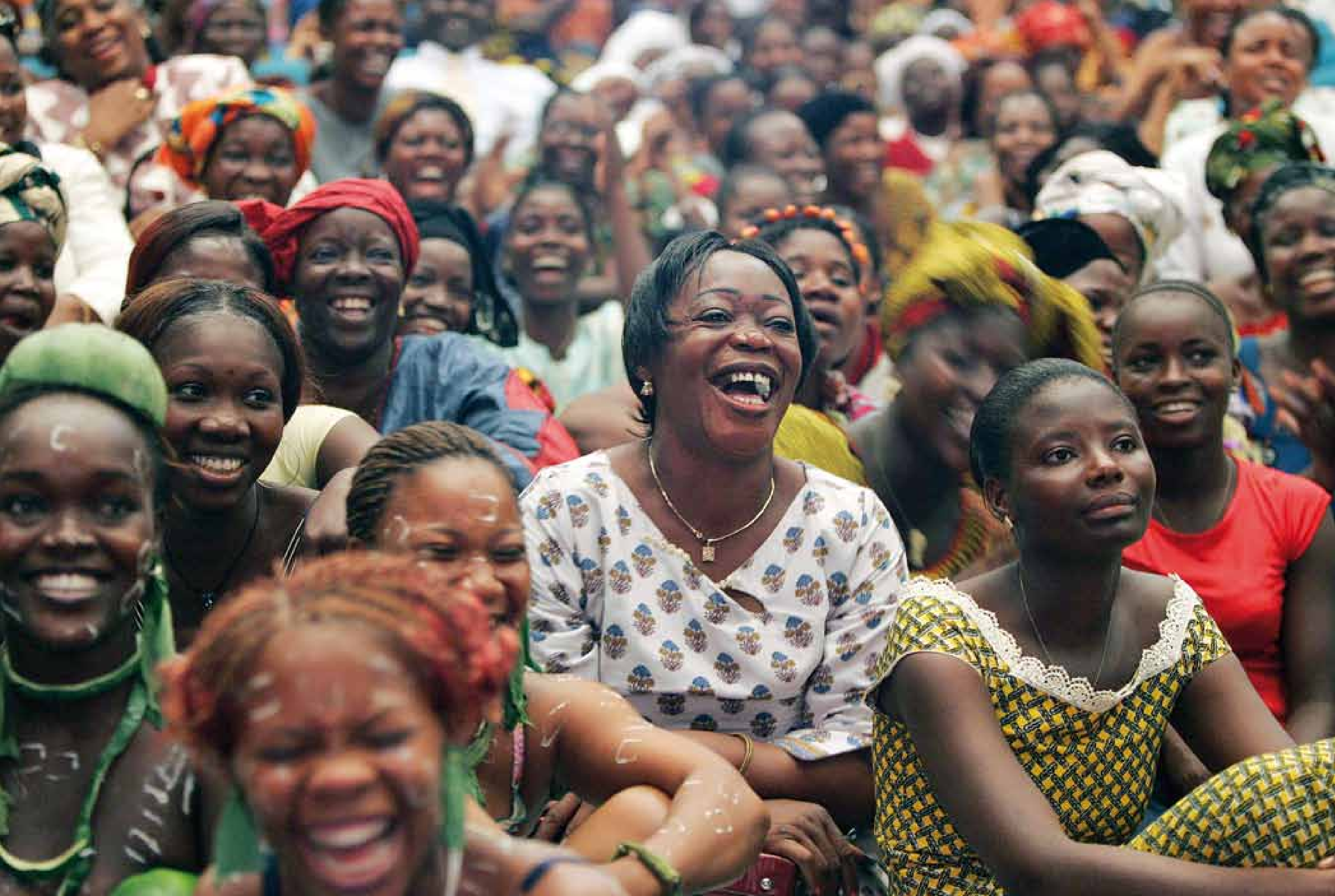
Elfenbeinküste, 2005: Frauen feiern den Internationalen Frauentag in Abidjan.