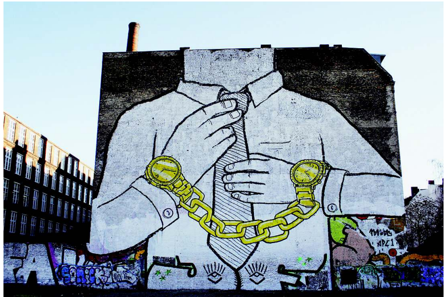
Gekettet an Konsum- und Wachstumszwang? Das muss nicht sein: Streetart von BLU in Berlin-Kreuzberg Foto: Mona Filz

Hinter dem Laden öffnet sich einladend ein wilder Garten, mit Tischen unter Bäumen, Spiegelreflexen, drehbarer Komposttrommel. Im Hauskeller der „Selbstverwalteten Ostberliner Genossenschaft“ summt ein hocheffizientes Miniblockheizkraftwerk, das Wärme und Strom aus Gas herstellt. Wasserspeicher sammeln Regenwasser für die Waschmaschinen, auf dem Dach arbeiten Solaranlagen. Zudem