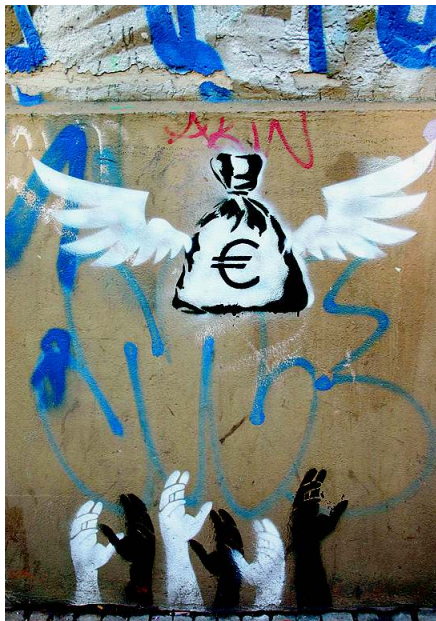
Das Geld ist weg – na und?

Rabhi. Der mittlerweile 71-jährige stieg in den 1960ern aus dem System aus, um in den Cevennen vom Ertrag des kargen Bodens zu leben, ohne diesen mit Dünger und anderen Chemikalien zu ruinieren. Er ist als internationaler Experte im Kampf gegen die Verwüstung anerkannt. Den gegenwärtigen Fortschrittsglauben bezeichnet dieser autodidaktische Philosoph als „Syndrom der ‚Titanic‘“. Mit seiner humanistisch, pazifistisch und spiritualistisch inspirierten Wirtschafts- und Gesellschaftskritik ist er einer der Pioniere der heutigen Wachstumsgegner.