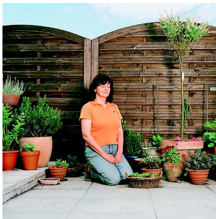
„Im Garten Ebel“: Gartenbesitzer im Bottroper Stadtteil Ebel träumen in ihren selbst geschaffenen Paradiesen

Ich war superstolz, dass sie mich ausgewählt hatte und dass ich so auch mal wieder ihre ganze tolle Familie – acht Geschwister! – wiederssehen konnte. Erzählt habe ich dann eine Episode aus dem Film „What the Bleep Do We Know“: Wasser kann mit positiver Information versehen werden und diese so auch übertra-gen. Auf dem Glas Wasser, das ich ihr dann überreicht habe, stand „Glück“. Das hat gepasst.