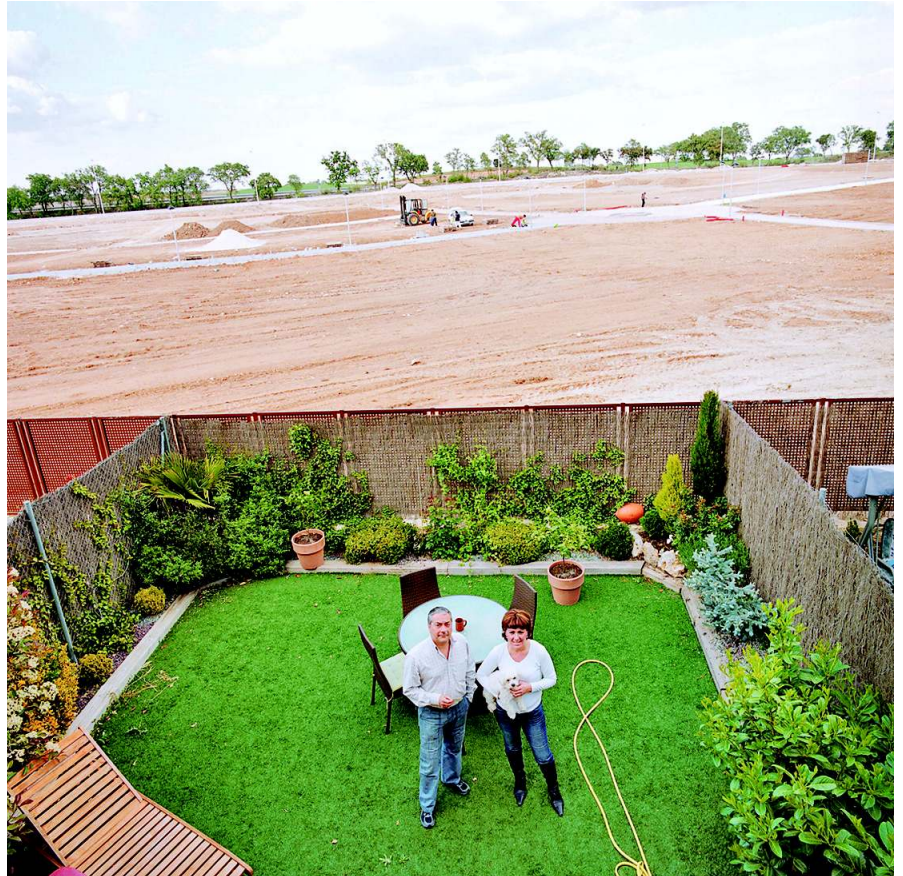
Baustopp in Castilla La Mancha. Die neue Stadt in Spanien war geplant für 10.000 Menschen, doch erst 500 kamen hierher

Auch diese Länder werden ihre hohen Wachstumsraten nicht durchhalten können. China kauft halb Afrika auf, um seine Rohstoffversorgung zu sichern. Es gab schon eine weltweite Rohstoffknappheit vor der Wirtschaftskrise, was man an den ho-